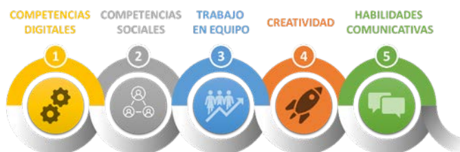
Figura 2: Competencias adquiridas con el uso de las redes sociales en la educación

Al introducir las redes sociales en la enseñanza universitaria se puede potenciar la adquisición de las competencias transversales que se muestran en la Figura 2.